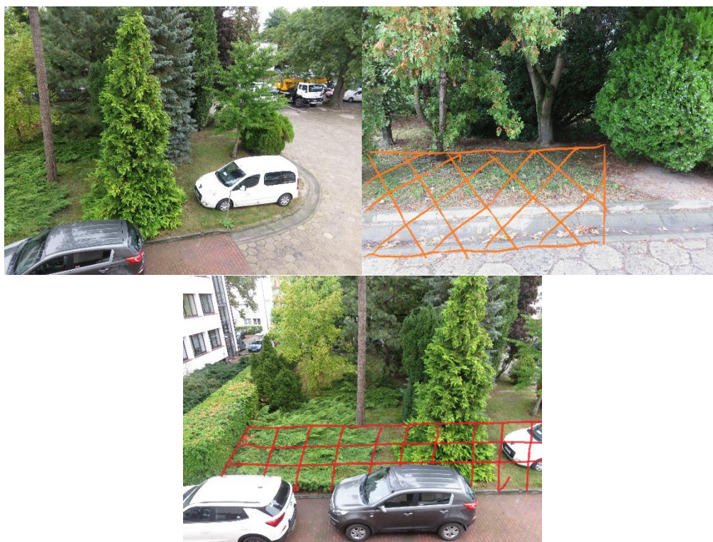
Granice nowego parkingu